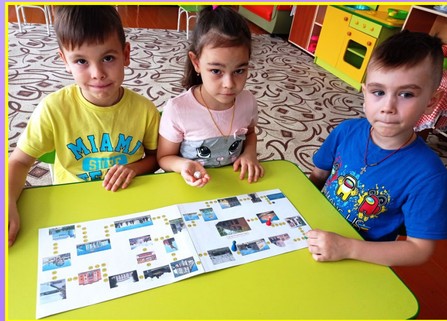
«Путешествие по Краснотуринску!»