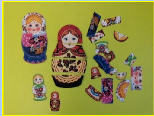
«Сложи правильно матрешку»