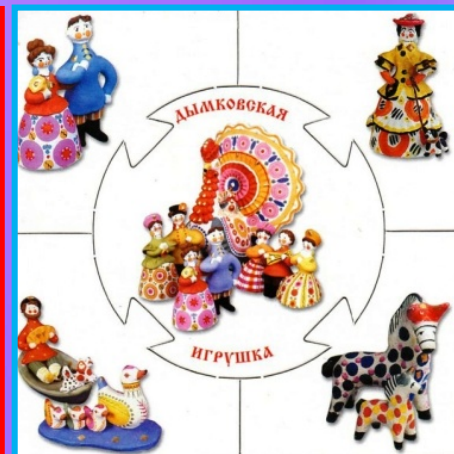
Лото «Народные промыслы»