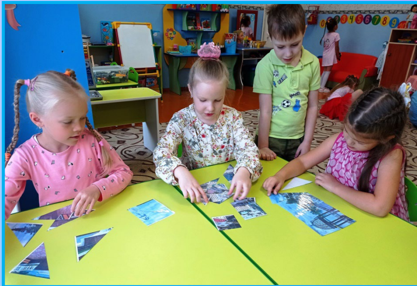
«Собери достопримечательность Краснотуринска»