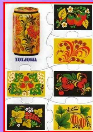
«Запомни народные промыслы»