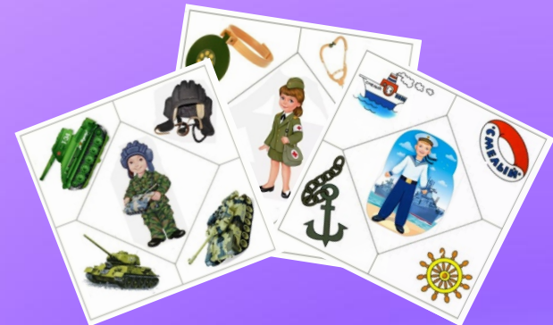
«Кому, что нужно»